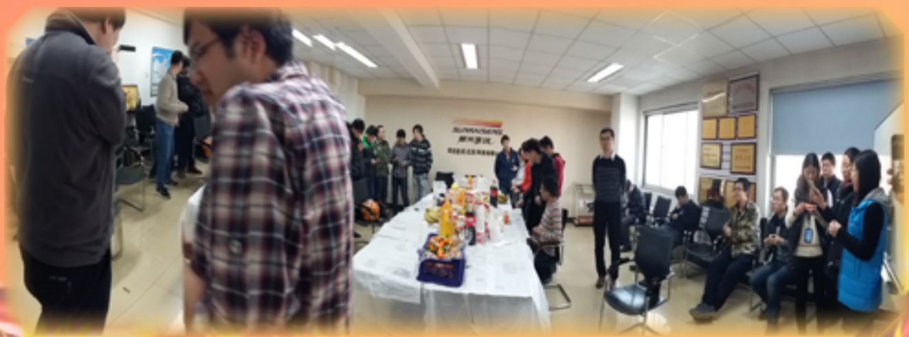
2015年12月31日，全体员工在六层会议室举行了“元旦聚餐”活动。